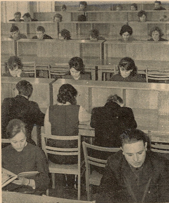
Экзаменацыйная сесія — адказны перыяд у жыцці студэнтаў. Дзе іх толькі не сустрэнеш у гэты час. НА ЗДЫМКУ: у бібліятэцы ўніверсітэта.